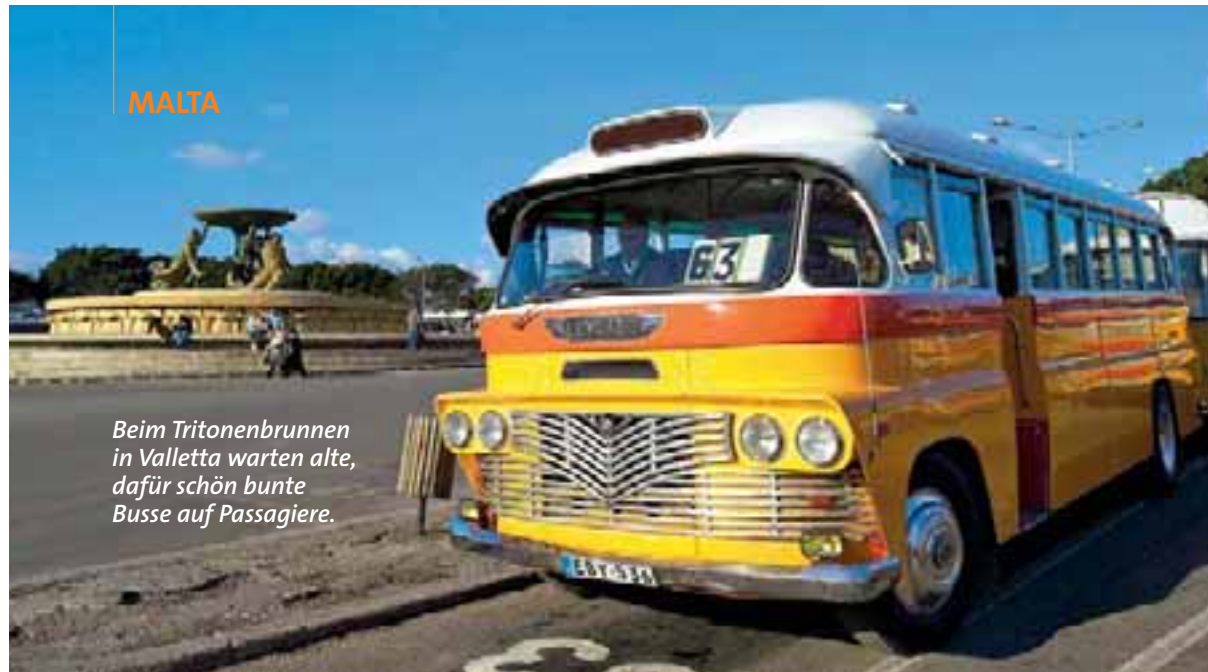
Beim Tritonenbrunnen in Valletta warten alte, dafür schön bunte Busse auf Passagiere.

Wer Malta mit wachen Augen und offenem Herz bereist, wird reich beschenkt: mit unvergesslichen Eindrücken, welche das Wiederkehren zur grossen Versuchung machen.