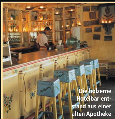
Die hölzerne Hotelbar entstand aus einer alten Apotheke

H otelito Desconocido« – Wird unser junger Fahrer dieses »kleine unbekannte Hotel« hier draußen, irgendwo in den nächtlichen Weiten von Südmexiko finden? Es ist eine rabenschwarze und schwülwarme Nacht über den tropischen Hügeln zwischen den Gipfeln der Sierra Madre und der unendlichen, menschenleeren Pazifikküste. Weiter südlich von Puerto Vallarta schießt Gott Bilder fürs Archiv: In den Wolken, darunter und darüber, flackern Blitzlichter – »electric storms« – unaufhörliches Wetterleuchten, himmlische Flammenwerfer eines unermüdlichen Feuerwerkers, dessen illuminierende