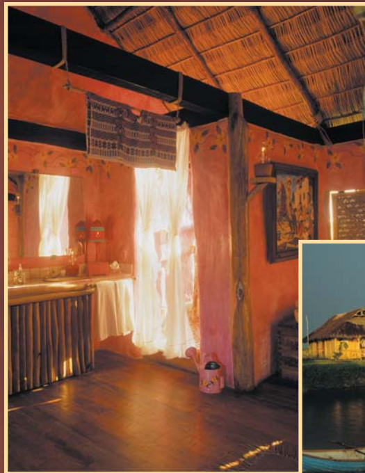
Motorboote Fehlanzeige! Für den Shuttleservice über die Lagune werden Paddelboote benutzt

Unter Flammenbäumen und Kokospalmen spazieren wir auf Sandwegen hinüber zum »El Cantarito« Restaurant, gleich neben dem Aussichtsturm und der Bootsanlegestelle. In der Nähe des kleinen Spas, umgeben von Seerosenteichen und Zuckerrohrfeldern, treffen wir Manager Frederico Spada, in Gummistiefeln und Kopftuch mäht er den sprießenden Rasen unter der heißen Sonne, ein wohl eher seltenes Bild im Kreise der erlauchten Small Luxury Hotels of the World, zu denen auch das Hotelito zählt. Frederico spricht vier Sprachen und kennt jeden Menschen, jedes Tier, jeden Baum und Strauch auf dem Gelände mit Namen, er ist Botaniker, Mechaniker, Biologe und Gastgeber in einer Person. Er tut einfach, was er kann. Wie seine 70 Angestellten auch, erzählt der »primus inter pares«: »Als einer unserer Bauarbeiter für die anderen gekocht hat, haben wir gesagt: ›Du kannst kochen! Willst du Küchenchef werden?‹ – Okay, dann wurde er Küchenchef!« Auf diese ungewöhnliche, aber höchst menschliche Weise rekrutiert sich bis heute das Personal, das ausnahmslos im Nachbardorf zu Hause ist. Jeder hat am Hotel mitgearbeitet, jeder ist mit ihm »verheiratet«, man kann jeden nach allem fragen, keiner wird achselzuckend die Zuständigkeit ablehnen, denn jeder fühlt sich verantwortlich für alle Belange, wie ausgefallen sie auch sein mögen, zu welcher Tageszeit auch immer. Die Menschen, denen das »Hotelito« 20 Titelstories in den berühmtesten Reisemagazinen und Fernsehse-