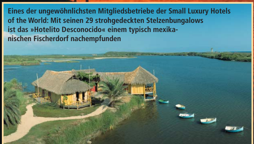
Eines der ungewöhnlichsten Mitgliedsbetriebe der Small Luxury Hotels of the World: Mit seinen 29 strohgedeckten Stelzenbungalows ist das »Hotelito Desconocido« einem typisch mexikanischen Fischerdorf nachempfunden