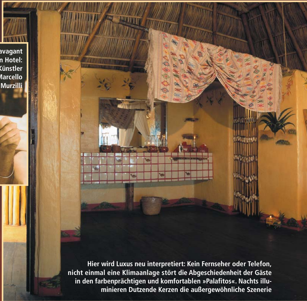
Hier wird Luxus neu interpretiert: Kein Fernseher oder Telefon, nicht einmal eine Klimaanlage stört die Abgeschiedenheit der Gäste in den farbenprächtigen und komfortablen »Palafitos«. Nachts illuminieren Dutzende Kerzen die außergewöhnliche Szenerie

Autor Jürgen Gutowski besuchte für Top hotel ein kleines Domizil, das gänzlich ohne Strom auskommt: das Hotelito Desconocido an der mexikanischen Pazifikküste